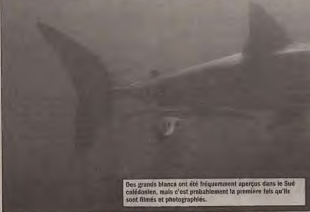
Des grands blancs ont été fréquemment aperçus dans le Sud calédonien, mais c'est probablement la première fois qu'ils sont filmés et photographiés.

L'îlot Ugo porte bien son surnom d'« île aux requins » puisque c'est à ses abords qu'ont été aperçus et photographiés à plusieurs reprises deux requins blancs entre jeudi matin et samedi soir.