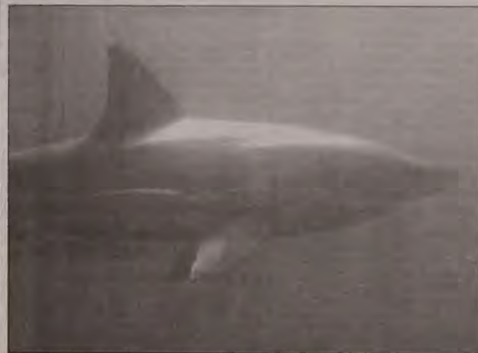
« Le lagon n'est pas un zoo aseptisé où l'on promène les enfants sans risque qu'un lion s'échappe de la cage. Il faut accepter les risques qui y existent. »